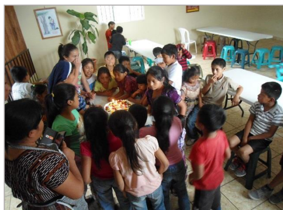
Celebración de cumpleaños