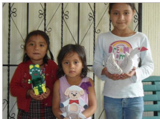
Los niños nos muestran las manualidades que han hecho