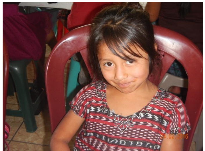
«Cuando sea mayor, yo también ayudaré a los demás»