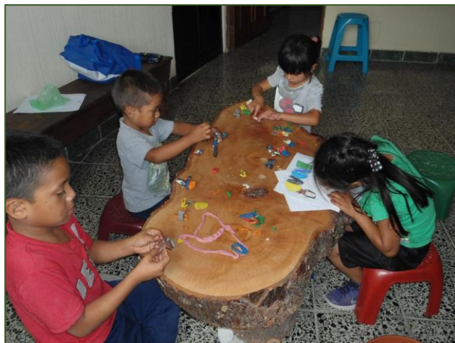
Los más pequeños desarrollan su creatividad con la plastilina