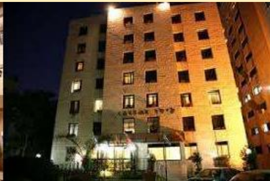
Hotel Cesar Premier (Jerusalén)