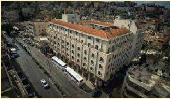
Hotel Mary's Well (Nazaret)