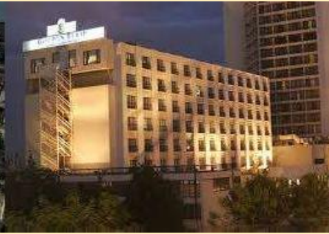
Hotel Grand Palace (Amman)