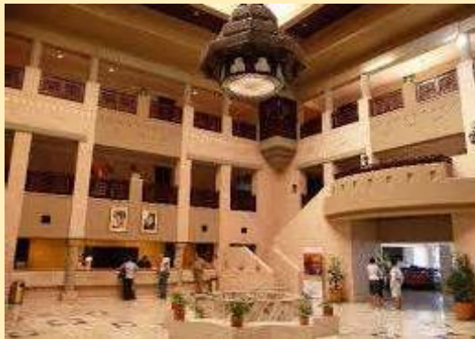
Hotel Nabatean Castle (Petra)