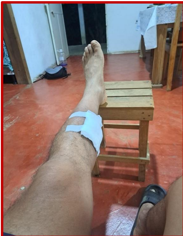
Guardando reposo absoluto

De hecho, apenas he logrado reponerme aún de un estúpido accidente (¿acaso alguno no lo es?), ocurrido casi a las puertas de mi casa. Me resbalé de mi motocicleta dándome de bruces contra el suelo y abriéndome una brecha bastante profunda en la pantorrilla de mi pierna izquierda. No consideré necesario acudir al Centro de Salud, pues con unos emplastos caseros la herida se cauterizó. Me sentía bien. Tanto que, al llegar el fin de semana, me trasladé al municipio vecino de Tucurú donde un grupo de amigos acostumbramos a desestresarnos jugando un partido de fútbol.