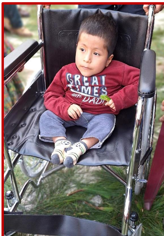
Fratisa, ofreciendo una silla a un pacientito