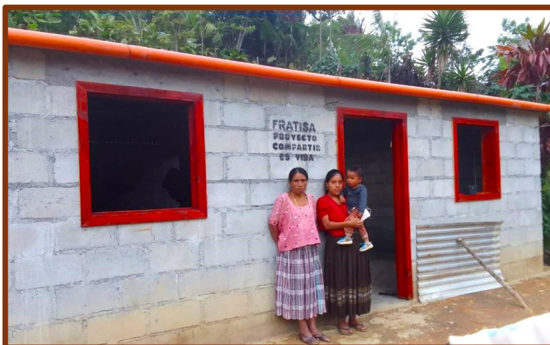
Disfrutando el solaz de un nuevo hogar, digno y confortable

Nos displace que los menores de edad se impliquen en tales labores. Mas así lo exige su costumbrismo. Para ellos es un tema innegociable que nosotros obviamente respetamos. A veces tardan hasta un par de semanas en trasladar los insumos de la obra. Pero lo hacen. ¡Y con solvencia! Causa cierta desazón ver cómo personitas de metro y medio de altura cargan -durante