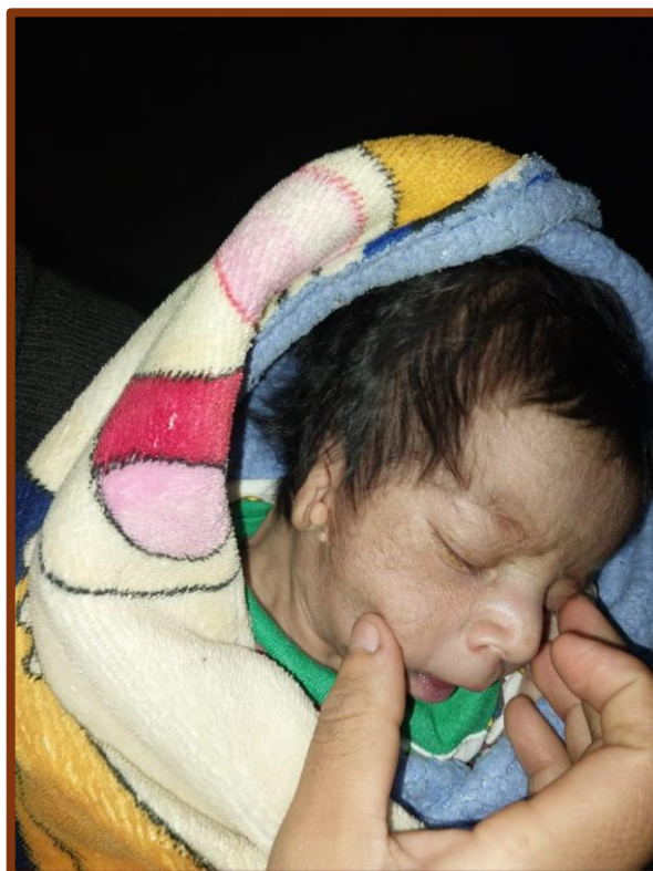
Las tristes secuelas de una desnutrición severa