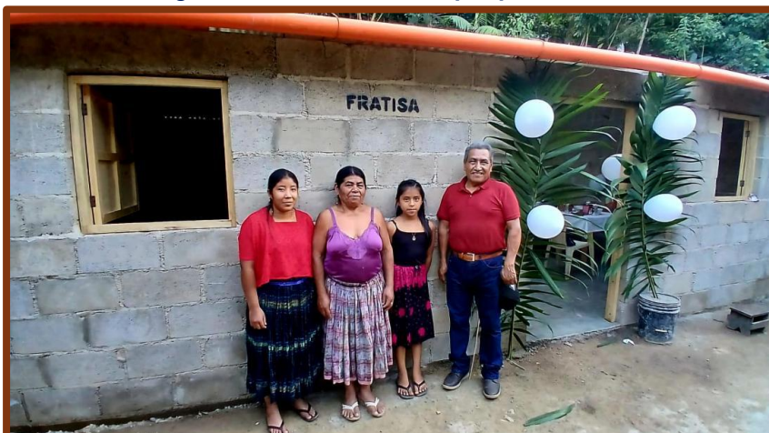
Siempre es muy grato el momento de inaugurar una nueva vivienda

media hora larga- sacos de cemento que pesan 50 kilos. Nada los frena, como ocurre con las hormigas en la icónica película “Cuando ruge la marabunta”.